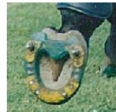
ew im Sprungeinsatz