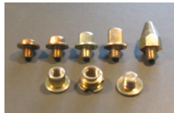
Stollen und Gewindeeinsätze